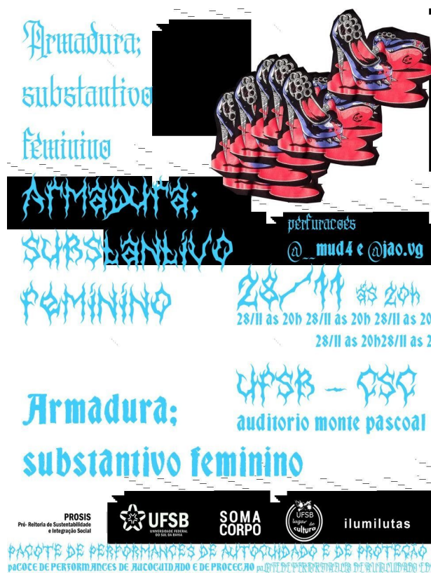
Fig 7: Arte de divulgação da performance "Armadura; substantivo feminino" FONTE: Arte de Caz Ângela Apolinário. Arquivo da autora.

Em "Armadura; substantivo feminino" também se questiona, assim como na performance AMARTES , o lugar em que a tatuagem e as modificações corporais são colocadas dentro da Academia e nos circuitos artísticos; não sendo reconhecidas como parte do cânone das artes ou contemplada em editais, financiamentos ou publicações, e ausentes das galerias, museus e acervos de arte. Procura-se reconhecer que, assim como a transgeneridade, as artes e saberes das modificações corporais resistiu e se fez sempre presente na sociedade e no fazer artístico.