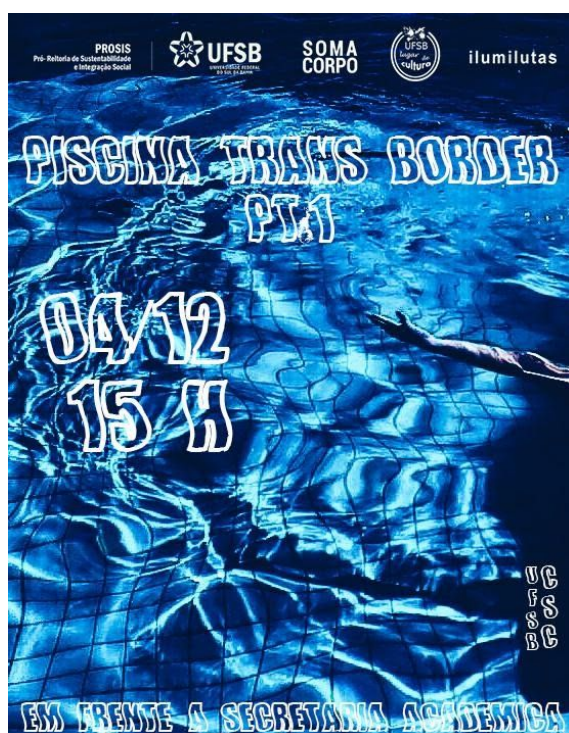
Fig. 8: arte de divulgação da performance "Piscina Trans Border"

FONTE: Arte de Caz Apolinário. Arquivo da autora.