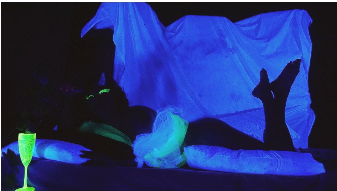
Fig 2: performer em ação, na performance "Amamenta-se Zeus leite de picadura

Pensando nas que sempre foram negadas ao leite, mas que até aos deuses amamentaram, esta performance intenc(s)ional inverte a luz sobre a mesa, as tetas, sobre a cama, sobre nossas corpas e, no ato performático, questionar o que é o leite, o que é o gozo, o que é o alimento, o que se come, o que se goza, o que é prazer, o que é nutrição. O que é dar; dar sustento ao organismo, ao social, ao espírito?