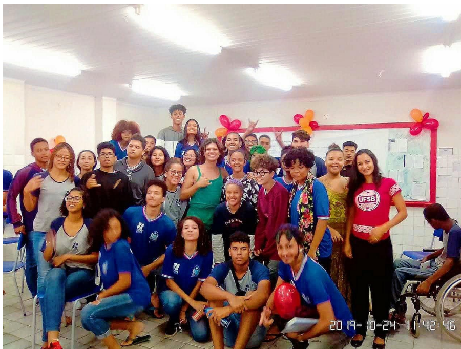
Fig.6: Registro da ação "Chá das 3"