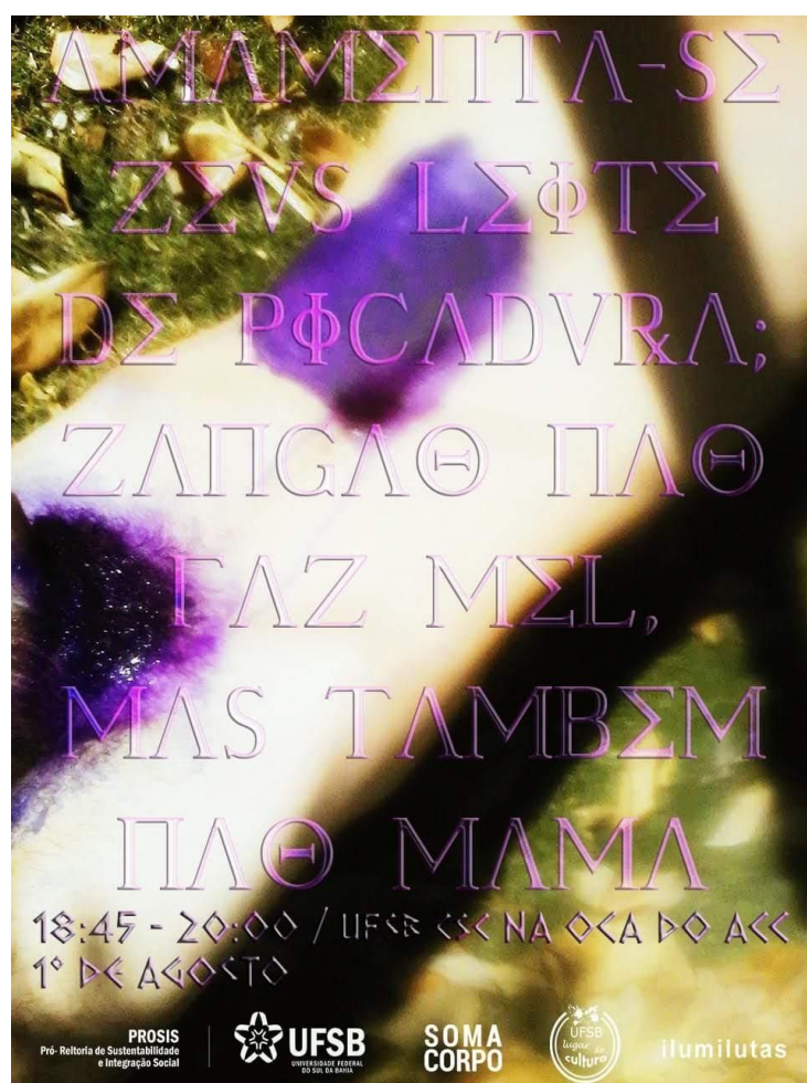
Fig 1: cartaz de divulgação da Performance "Amamenta-se Zeus leite de picadura [...]"

Nesta performance, temos a criação de um ambiente escuro, onde se encontra nua com dois chifres na face, a performer . No espaço, um colchão forrado em lençol preto, seis travesseiros brancos, um travesseiro preto, uma bacia transparente com leite condensado, uma taça de vidro com ramas de batata roxa, uma faca grande com o cabo derretido e pintado de rosa, um pedaço de tule na cor verde e quatro garrafas plásticas, um pote plástico e uma jarra de vidro, todes contendo dentro água com gás. A iluminação consiste em três lâmpades negras, estando uma no teto focando onde se encontra a performer , e as outras duas, em refletores posicionados no chão.