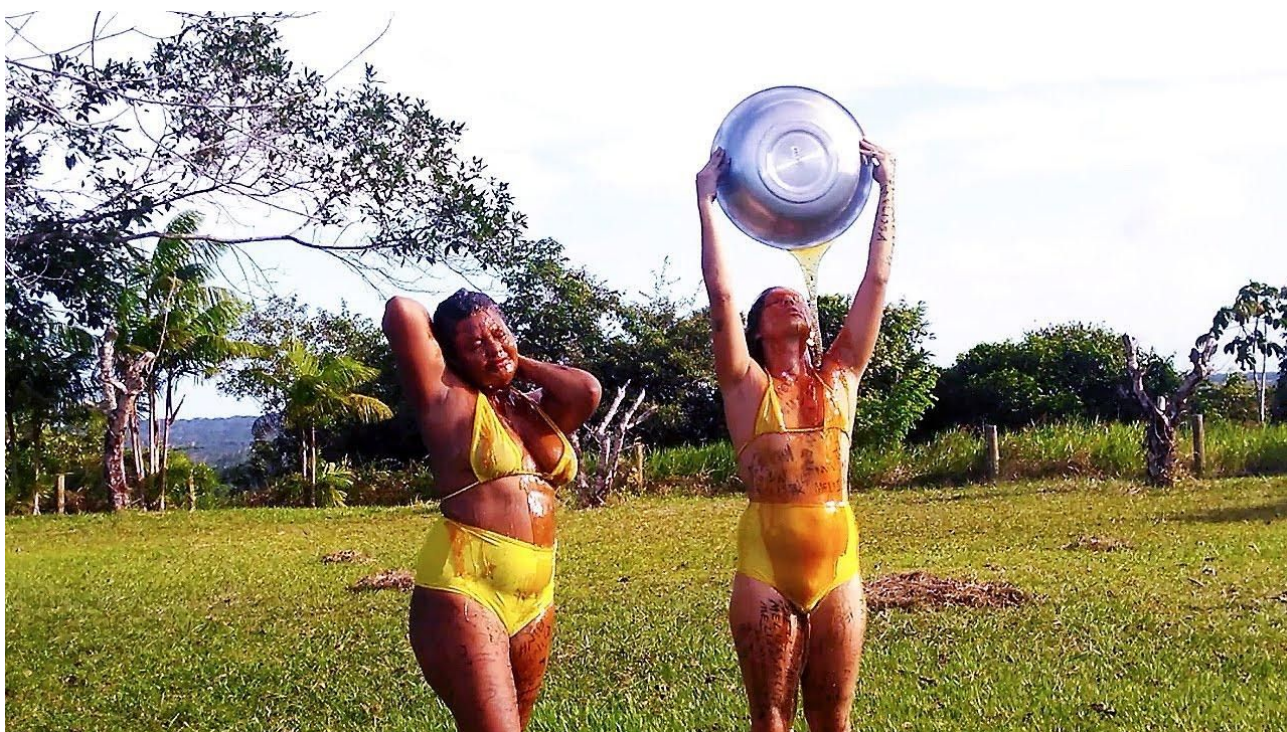
Fig 5: performers em ação, na performance "Mels"

Em sequência, apanham as bacias com mel de limão e canela do gramado, e as oferecem ao público; depois retornando onde estavam as bacias, derramam sobre suas corpos o restante dos treze litros de mel. Ao fim, toca o instrumental da música "Ever Again", da cantora sueca Robyn; em seguida, cobertas de mel, as performers se beijam, se abraçam e trocam carícias e carinhos; rolam pela grama para, depois de mãos dadas, fazerem uma caminhada pelo campus da UFSB, terminando de volta ao banheiro feminino.